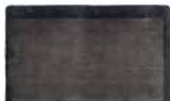
9 DIBBETS CAMBRÉ TAPIS CM 400X400